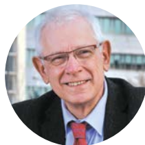
Philippe Meirieu, pédagogue et parrain de la Rentrée solidaire

« Les enfants et les jeunes ont besoin de concret pour s'engager. Avec cette campagne, ils découvrent combien il est enthousiasmant de se mobiliser. Et, grâce aux activités pédagogiques, ils s'ouvrent à des questions citoyennes comme le droit à l'éducation et la lutte contre les inégalités. »